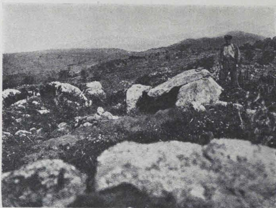
Fig. 70. — Sant Climent Sassebes. Sepulcre de Fontanilles